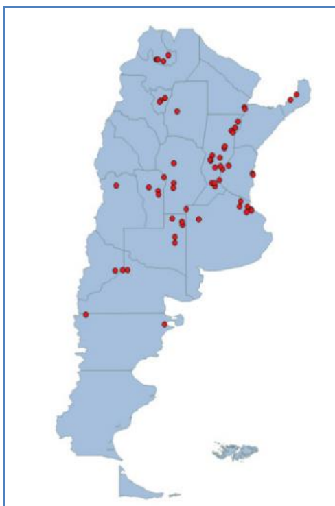
Ilustración 2- Ubicación geográfica de las plantas relevadas.

De las plantas relevadas, el 53,1% de las plantas pertenecen al sector privado, el 37,5% al sector público, y el porcentaje restante pertenece a cooperativas y ONG.