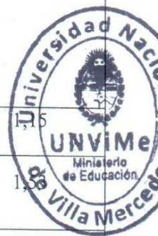
Tabla de distribución horaria y porcentual por área: